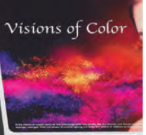
Visions of Color