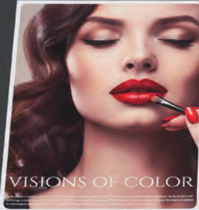
VISIONS OF COLOR

Meta Metro Museum HIDDEN GOLD & SILVER ART 2023 5 MAR - 7 SEP